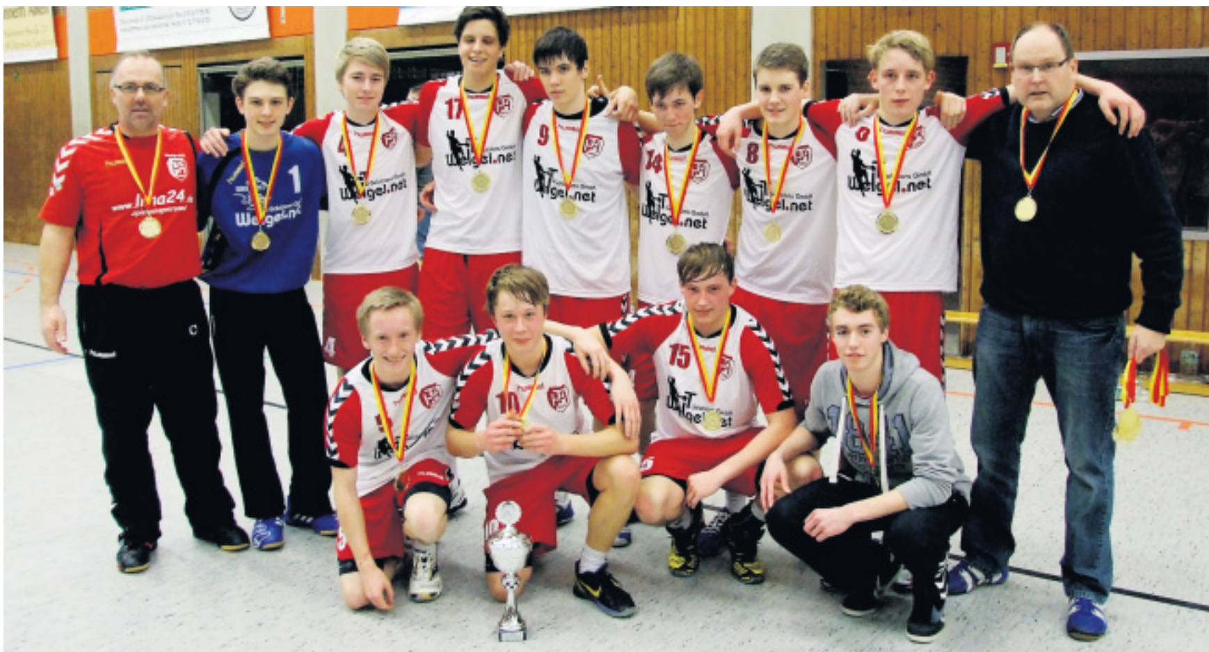
Altkreismannschaft des Jahres 2011: Die B-Jungen stiegen in die Handball-Oberliga, wurden Dritter der Bezirksmeisterschaft und Kreispokalsieger.

Die Altkreissportlerwahl erfreut sich ungebrochener Beliebtheit. Erneut gaben mehr als 1300 Leserinnen und Leser exklusiv über die Internetseite und den Gewinncoupon des Haller Kreisblattes ihre Stimme ab und sorgten so für ein aussagekräftiges Ergebnis. Herzlichen Dank!