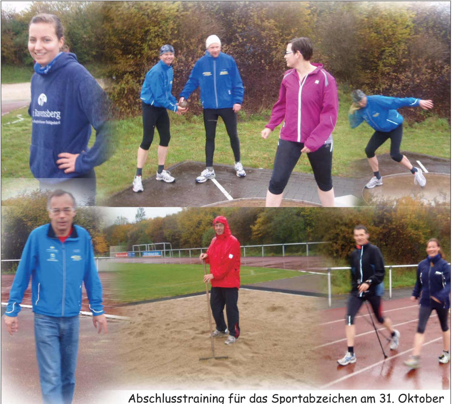
Abschlusstraining für das Sportabzeichen am 31. Oktober

Petrus scheint kein Freund vom Sportabzeichen zu sein, sonst hätte er es am letzten Sonntag im Oktober nicht so regnen lassen. Trotzdem fanden etliche Sportler den Weg ins Borgholzhausener Stadion, ob noch die fehlenden Disziplinen nachzuholen.