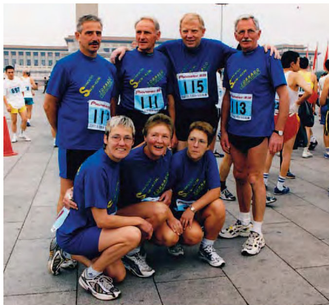
Teilnehmer/innen des Halbmarathons 2001 vom LC Solbad Ravensberg