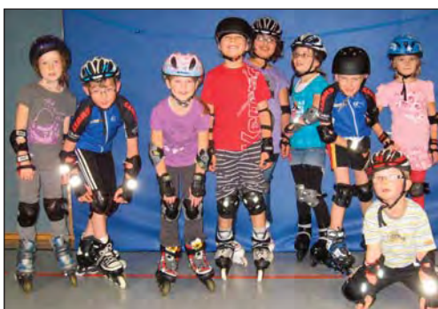
Das Foto zeigt die Teilnehmer der Freitagsgruppe.