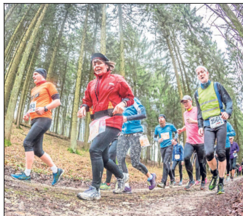
Trotz starker Regenfälle in den vergangenen Tagen: Die Wege im Teuto sind steil, aber gut zu belaufen.