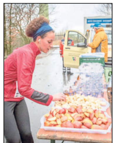
Hunderte Äpfel und Bananen, 800 Liter Tee, 200 Liter Wasser: Die Verpflegungstationen sind gut bestückt.